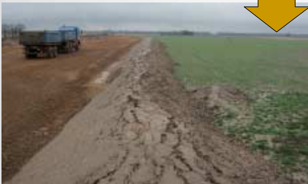
Durch Verkehrswege- und Siedlungsbaumaßnahmen werden zunehmend landwirtschaftliche Flächen - oft auch fruchtbarste Lössböden - vernichtet

Rein rechnerisch wird jeden Monat die gesamte Betriebsfläche eines Landwirts überbaut. Bei durchschnittlich 70 % Pachtflächenanteil sind von dieser Entwicklung - bei der kein Ende absehbar ist - viele Betriebe in ihrer Existenz bedroht.