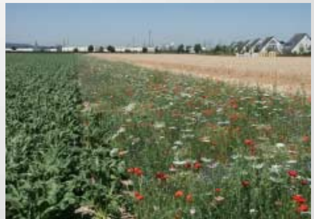
Heute noch Zuckerrüben und Weizen mit Blühstreifen. Demnächst wird alles Streuobstwiese und Feldgehölz. Für den derzeitigen Pächter katastrophal. Integrative Kompensationsmaßnahmen könnten helfen

Landwirte verlieren also zweifach Fläche: einmal für die Baumaßnahmen und einmal für den Ausgleich. Insbesondere Pächtern wird dadurch die Einkommensgrundlage entschädigungslos entzogen. Und selbst die Naturschutzverbände bezweifeln zunehmend, dass durch die üblichen Aufforstungs- und Sukzessionsmaßnahmen die Lebensbedingungen für die typische Flora und Fauna der Feldflur wirksam verbessert werden können.