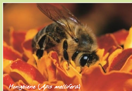
Honigbiene ( Apis mellifera )

Kulturpflanzen bieten oftmals ein großes Angebot von Pollen und Nektar. Honigbienen sind Generalisten und können somit alle blühenden Kulturpflanzen als Nahrungsquelle nutzen. Einige Wildbienenarten hingegen sind so spezialisiert, dass sie diese Nahrungsquellen nicht nutzen können. Ein vielfältiges Futterangebot von Wild- und Kulturpflanzen bietet somit die beste Möglichkeit, viele verschiedene Bienenarten zu fördern. Somit trägt es zur Sicherung des Ökosystems Kulturlandschaft als Lebensraum und Grundlage unserer Nahrungsmittelversorgung bei.