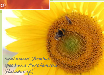
Erdhummel ( Bombus spec. ) und Furchenbiene ( Halictus sp. )