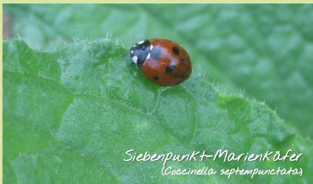
Siebenpunkt-Marienkäfer ( Coccinella septempunctata )

Zwei fünf bis sechs Meter breite Brachestreifen begrenzen die ackerbaulich genutzte Fläche an zwei gegenüberliegenden Seiten. Teilbereiche der Brache werden in regelmäßigen Abständen gegrubbert, um vegetationsfreie bzw. -arme Bereiche zu erhalten, die sich leicht erwärmen. Diese vegetationsarmen Flächen bieten insbesondere für Laufkäfer geeignete Jagdreviere.