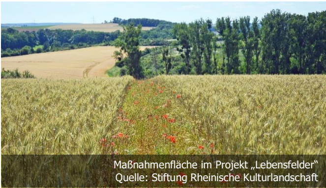
Maßnahmenfläche im Projekt „Lebensfelder“