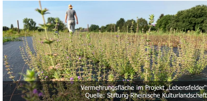
Vermehrungsfläche im Projekt „Lebensfelder“